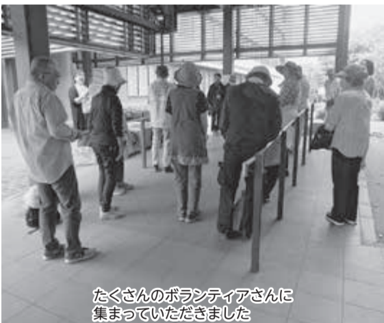
たくさんのボランティアさんに集まっていただきました