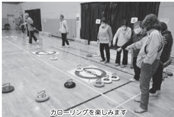
カローリングを楽しみます