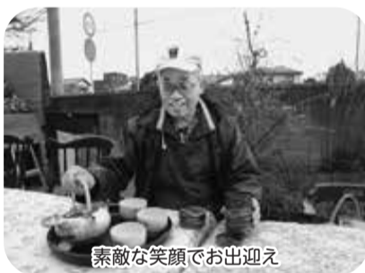
素敵な笑顔でお迎え

お花見は毎年、家族やご近所さんと開催しています。今回社協からの声かけで、自宅の庭を定期的に開放して、ガーデンサロンとして開催していただくことになりました。