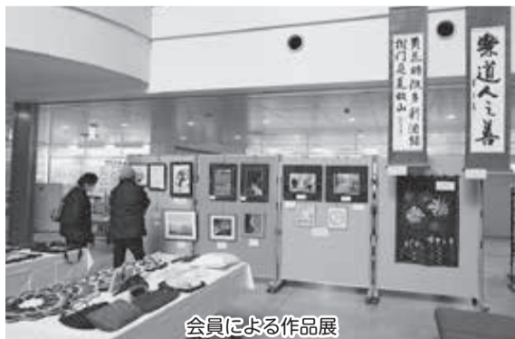
会員による作品展