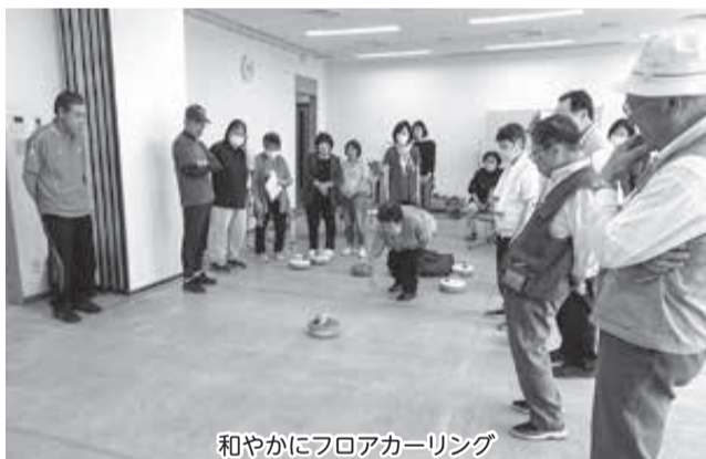
和やかにフロアカーリング