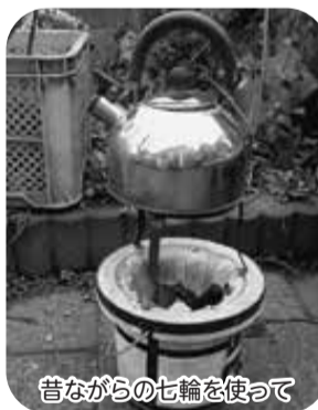
昔ながらの七輪を使って

よく手入れされた庭には多くの庭木があり、その全てに名札が付けてありました。当日はミツマタの花が見事でした。庭木の間や屋根などには、さりげなく置物が並べられ、住人の心の豊かさを感じられました。