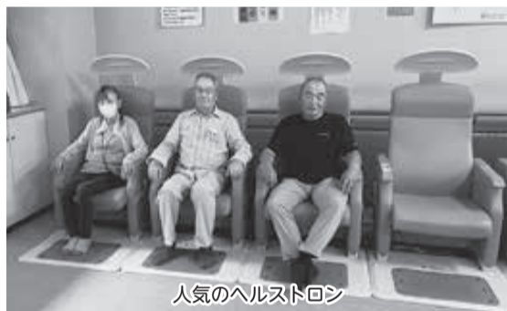
人気のヘルストロン