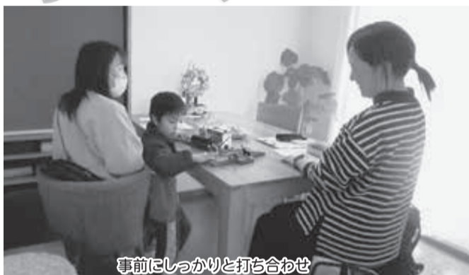
事前にしっかりと打ち合わせ

保護者が急な用事などの際に保育園に迎えに行ってもらったり、家庭にいる人も急用がきたり通院時など、お子さんを預かってもらうことができます。提供会員・利用会員・アドバイザーが事前に活動の日時やお子さんのことについて細かい打ち合わせをします。