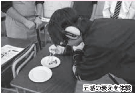
五感の衰えを体験