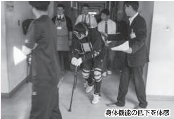
身体機能の低下を体感

高齢者疑似体験を通して、子どもたちからは、「荷物を持ってあげたい」「困っている人がいたら声をかけてあげたい」などの優しい感想が聞かれました。