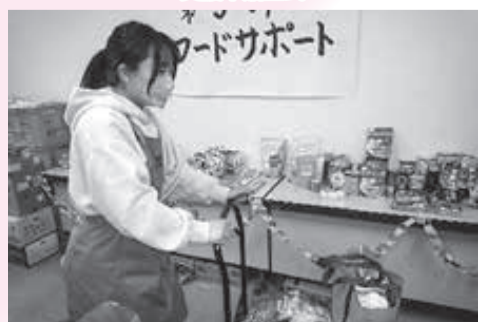
心を込めて食品配布しました